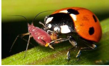
وينةى ميرووي خالوكة

نابيتة هوي هيض نةخوشيةك بو مرؤظ بة ميرووةكى سود بةخش دادةنريت له بواري قةلاضوكردى زيندطى دذي شوكة و هنديك ميرووي تويكلدار كة بقرهامةكانى كيلطة دةخون بة خيرايي و بة بريكى زور (chapman, 2000)